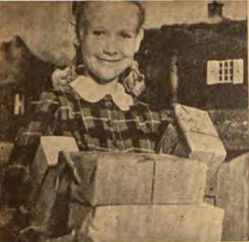
Шведска червенокръстка с подаръци за своите пострадали от войната другарчета в чужбина.