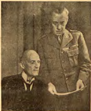
Председателят на Шведския червен кръст г. Бернадот приема доклад.

1. Всяко национално дружество, което има Младежки Червен кръст, да вземе веднага най-добри мерки за засилване на персонала, бюджета и организацията му по такъв начин, че Младежки Червен