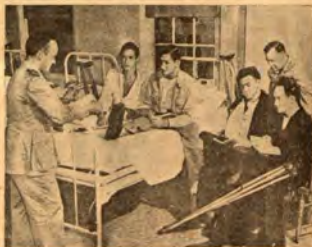
В една финландска болница

Болницата, която Финландския Червен кръст основа в Хелзинки има 200 легла. Тя служи за хирургически център и като пост за първа помощ. Там се лекуват особено наранявания на черепната ку-