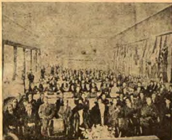
Червенокръстката конференция в Стокхолм заседава

изображение на невидимата с просто око звезда.