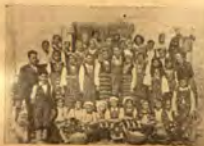
Клон на МЧК в Пловдив, Варошево

ставките за общо действие от всички клонове с отчитане дейността пред Върховното управление и изпращане дописки до сп. „Аз служба“.