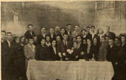
Върховното управление на БМЧК в пълен състав