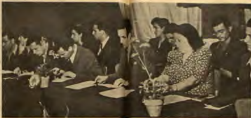
Делегати правят доклад и конференцията

С това преобработеното заседание във Военния клуб завърши. Групово заседание се отпразва за един от ресторитите „Хорема“, където ни бе сервирен обед.