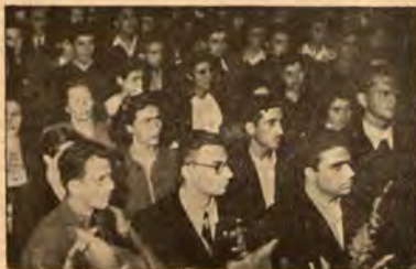
Част от делегатите

След изказванията на делегатите бе сложен на разглеждане уставът на организацията. Уставът бе докладван от Ленко Антонов , организационен секретар на БМЧК. Докладваните бяха също измененията, които комисията по устава е направила в първоначалния проект на Върховното управление. Всеки делегат имаше на ръка по един отпечатан проекто-устав.