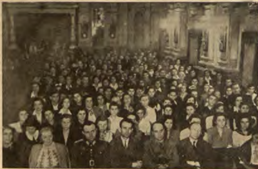
Общ вид на конференцията

Ето защо сближението, сработването, което трябва да се получи по места, трябва да бъде пълно. Ние ще работим неделимо с клоновете на Червен кръст при осъществяването на тази задача. Ние трябва да си поставим като главно условие да изпълним в тази част плана на старши Червен кръст, да вземем дейно участие при създаването на санитарни кадри.