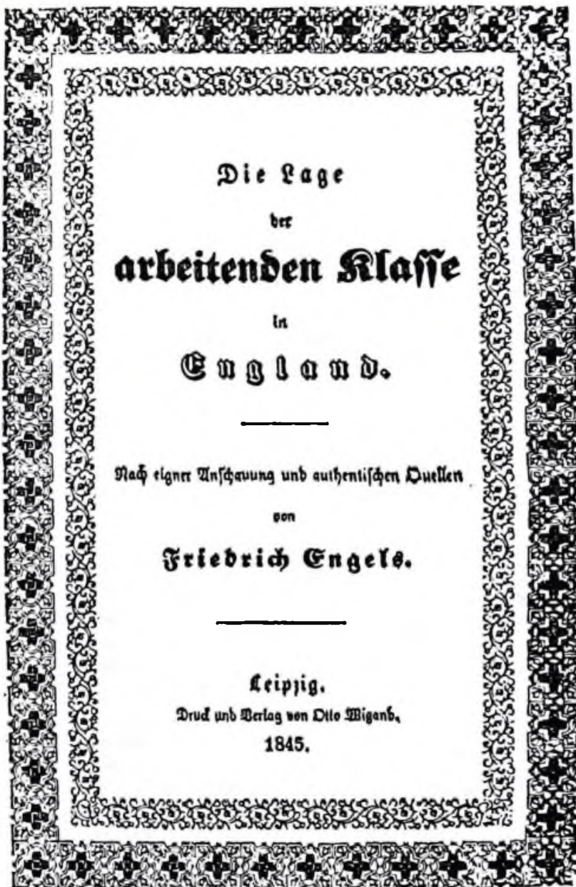
Заглавна страница на първото издание на «Положението на работническата класа в Англия» — 1845 г.