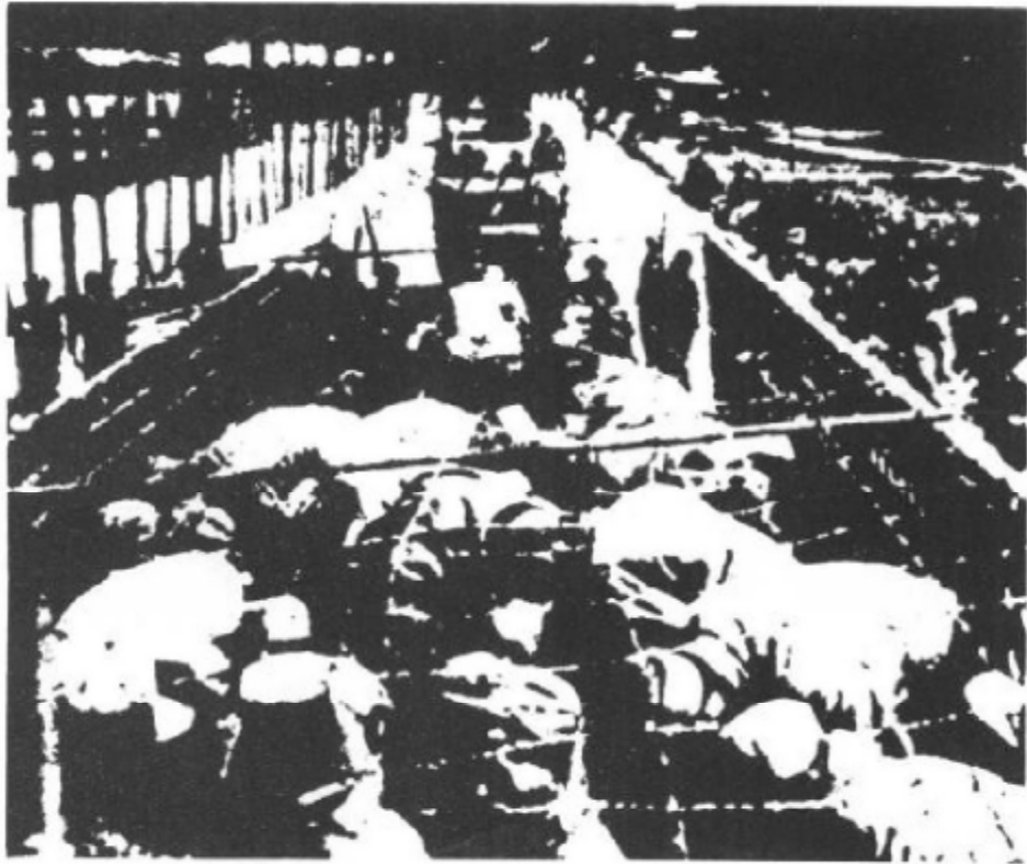
坚决要求回国的战俘们被装在带刺的电线覆盖的货车上,由全副武装的士兵押往隔离地点。