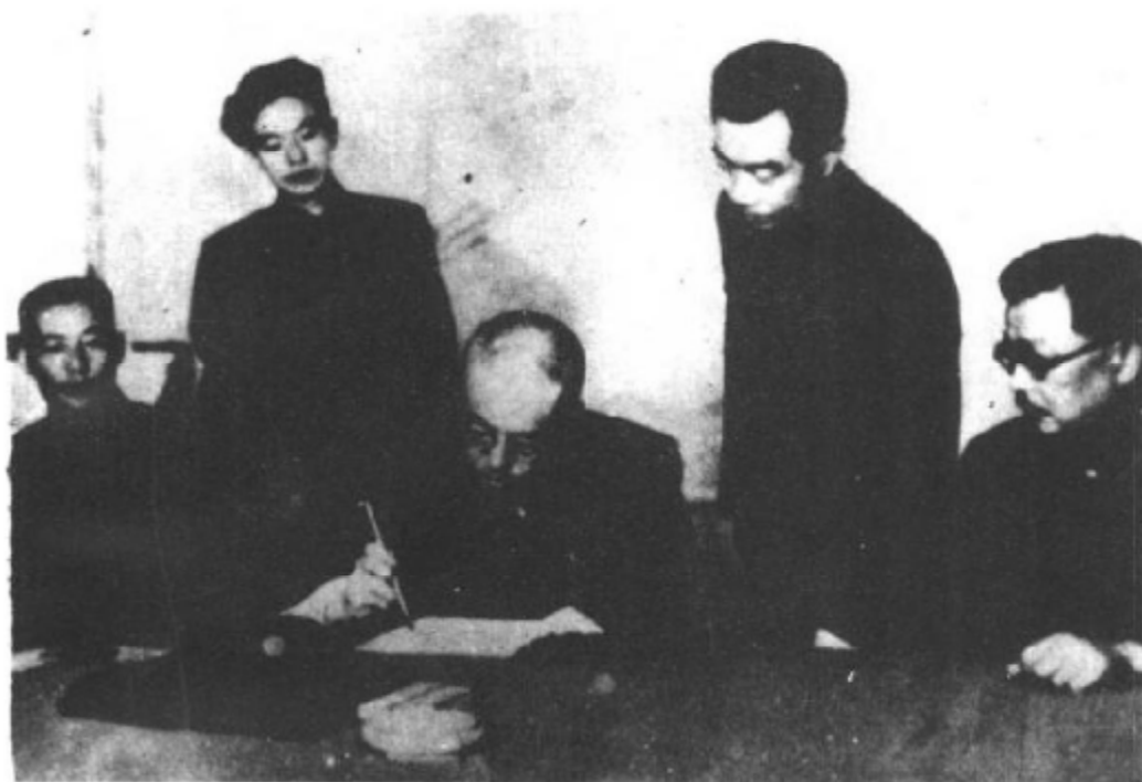
1953年7月28日,彭德怀司令员在停战协定文本上签字,右为李克农,左为杜平。

被遣返的中国人民志愿军病伤员一批244人在1953年5月13日回到祖国,当他们经过安市街头时,受到安东各界人民的欢迎。