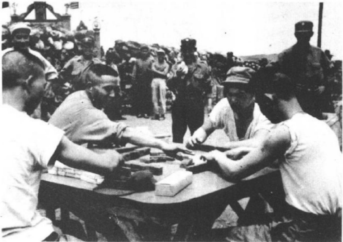
在济州岛,美军对坚持遣返回国的志愿军战俘进行血腥屠杀同时,对不愿接受遣返的战俘送麻将供他们赌博玩耍。