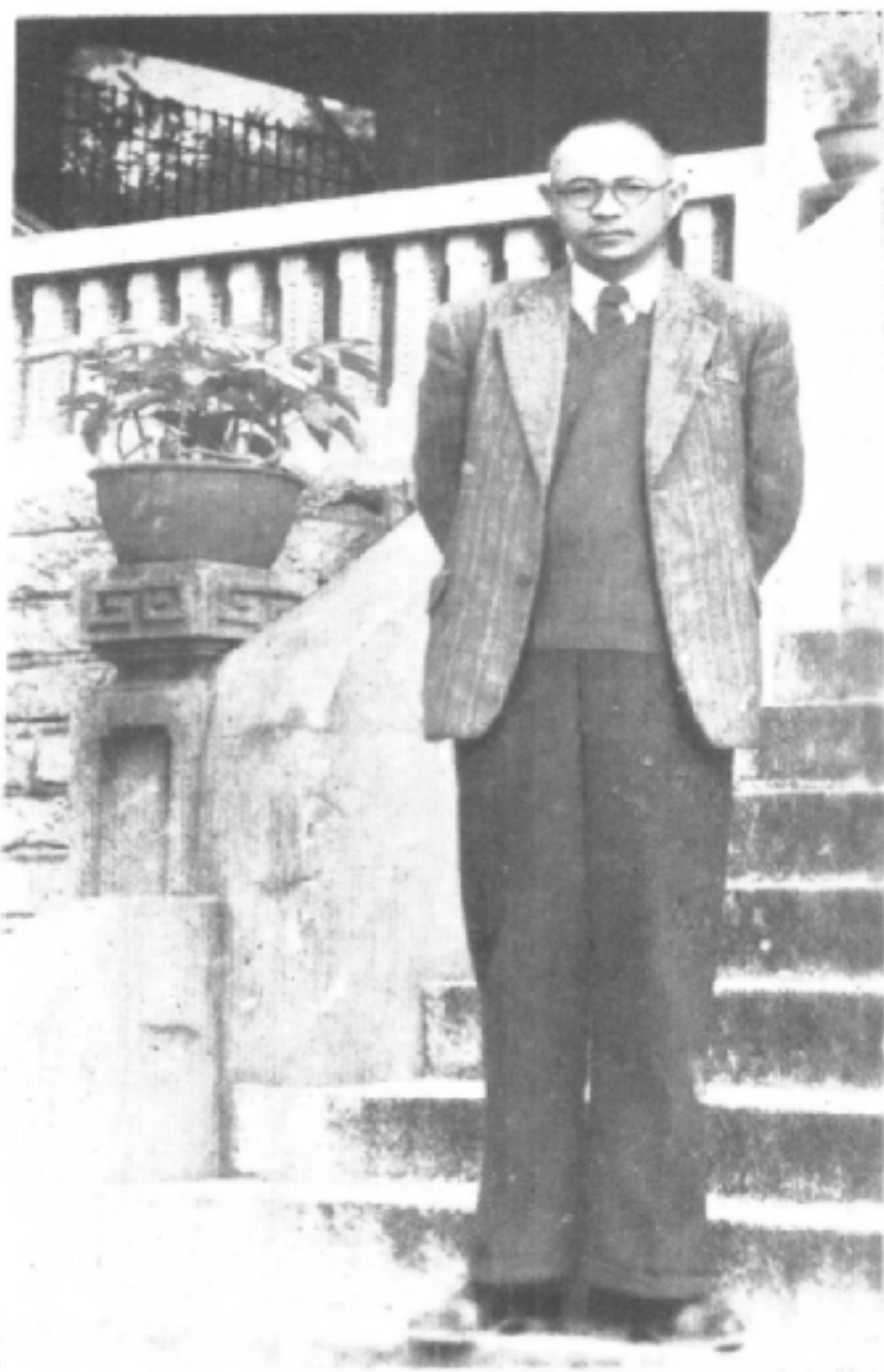
1954年王亚南撰写《中国地主经济 封建制度论纲》时的照片