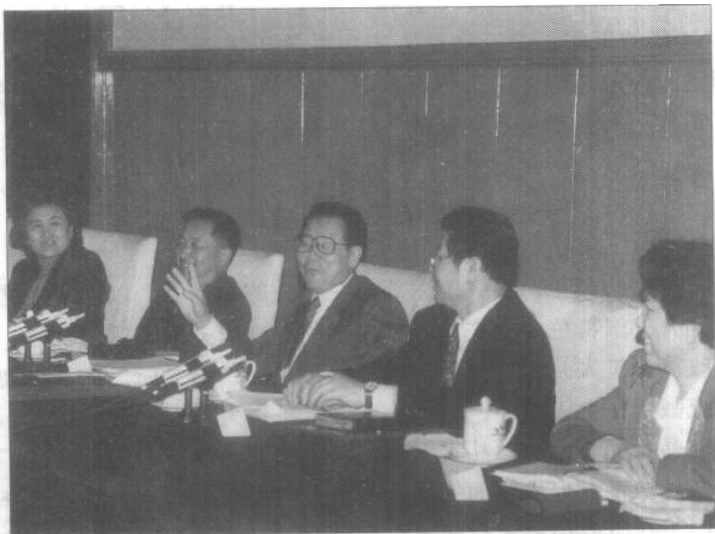
从左至右：中央统战部副部长刘延东、蒋民宽，中共中央政治局常委、全国政协主席李瑞环，中央统战部部长王兆国，中央统战部副部长万绍芬