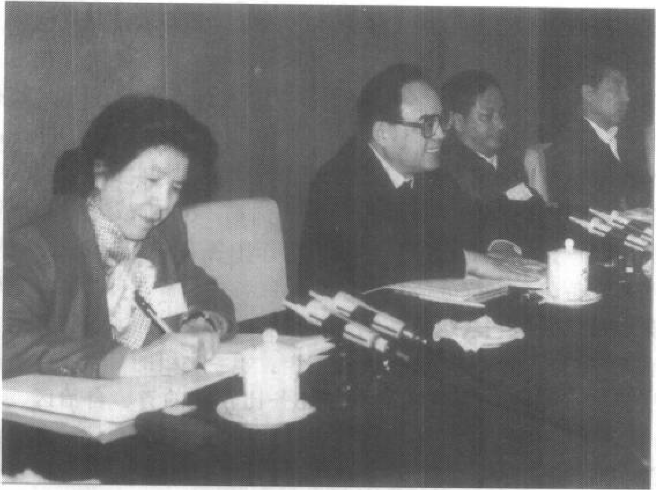
从左至右：中央统战部副部长万绍芬，中央统战部部长丁关根， 中央统战部副部长蒋民宽、武连元