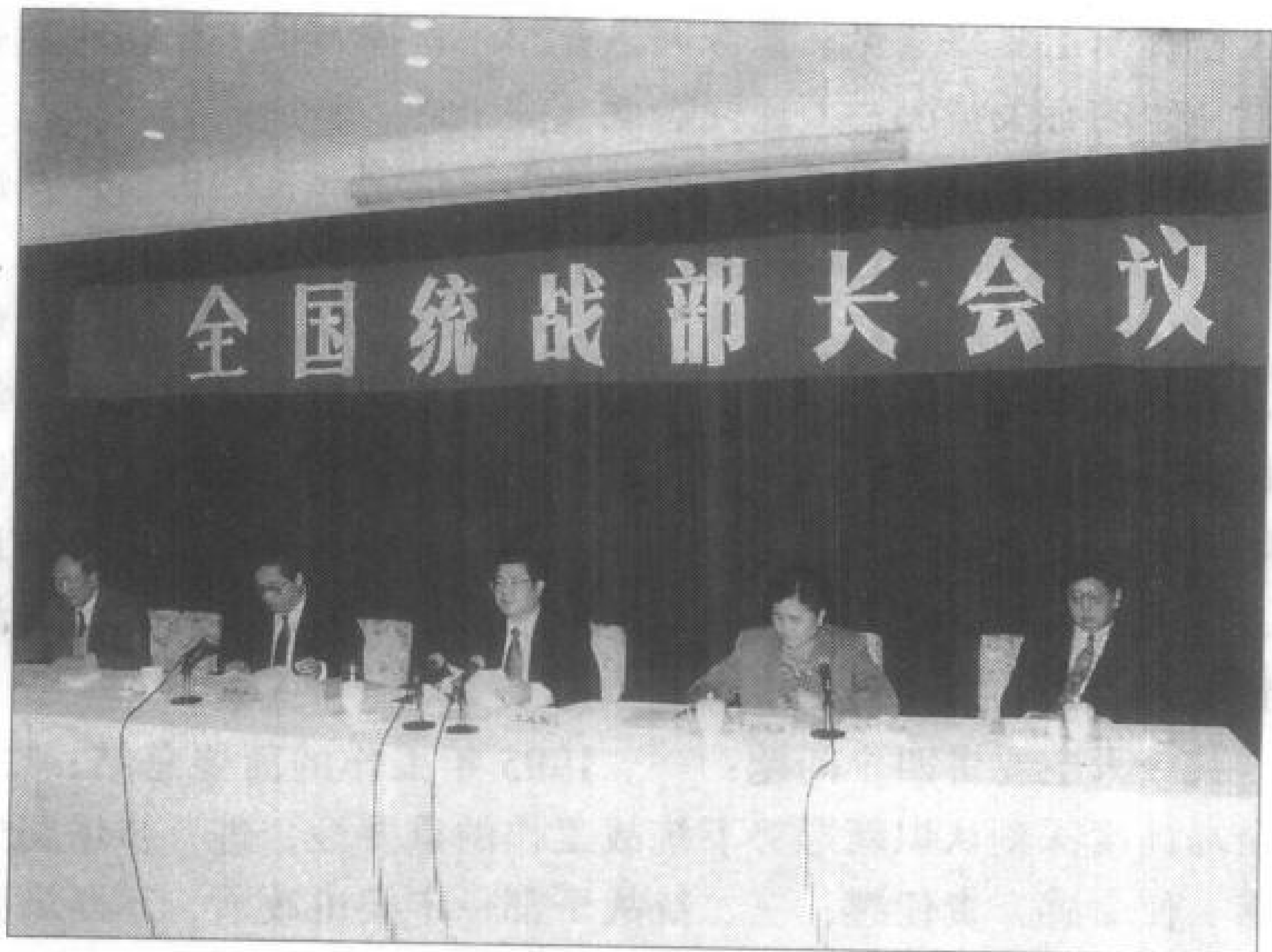
从左至右：中央统战部副部长张廷翰、李德洙，中央统战部部长王兆国，中央统战部副部长刘延东、郑万通