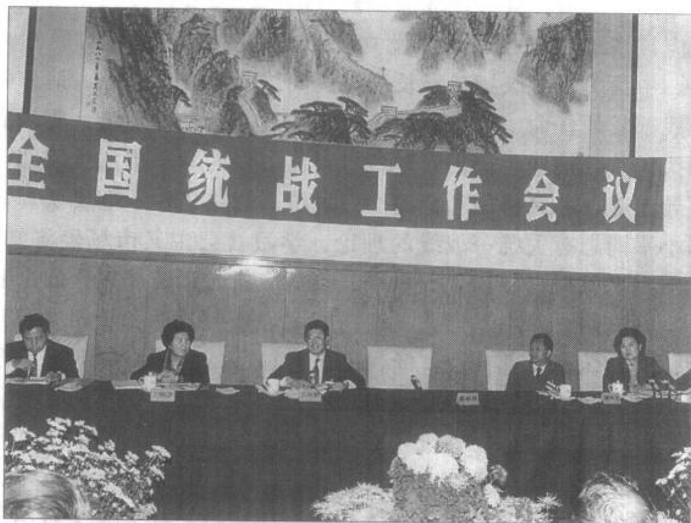
从左至右：中央统战部副部长李德洙、万绍芬，中央统战部部长王兆国，中央统战部副部长蒋民宽、刘延东