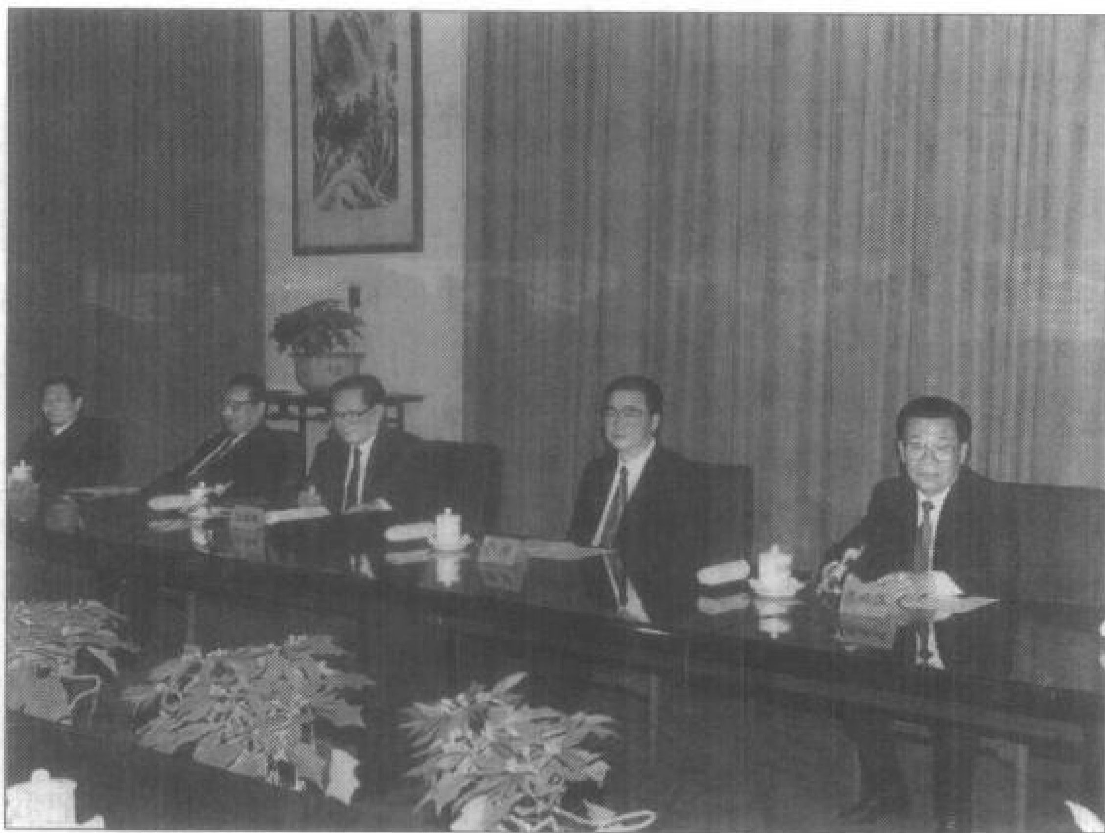
从左至右：朱镕基、乔石、江泽民、李鹏、李瑞环