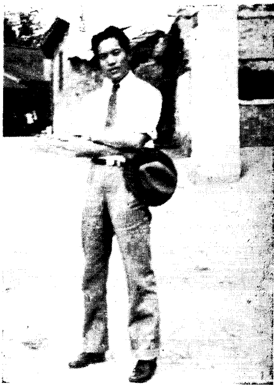
一九五五年作者摄于南京