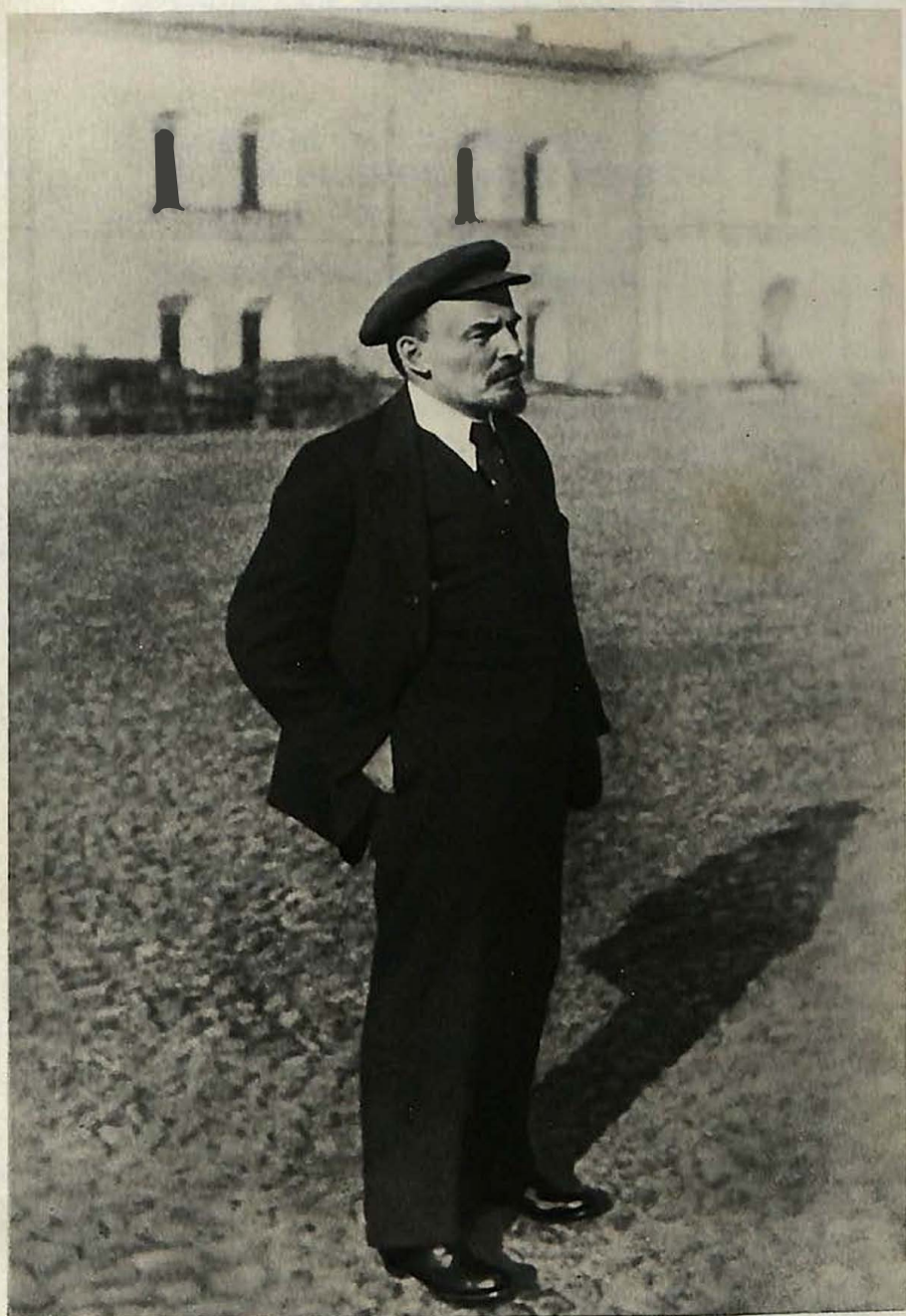
V. I. Lenin paseando en el patio del Kremlin convaleciente después de la herida. Octubre de 1918