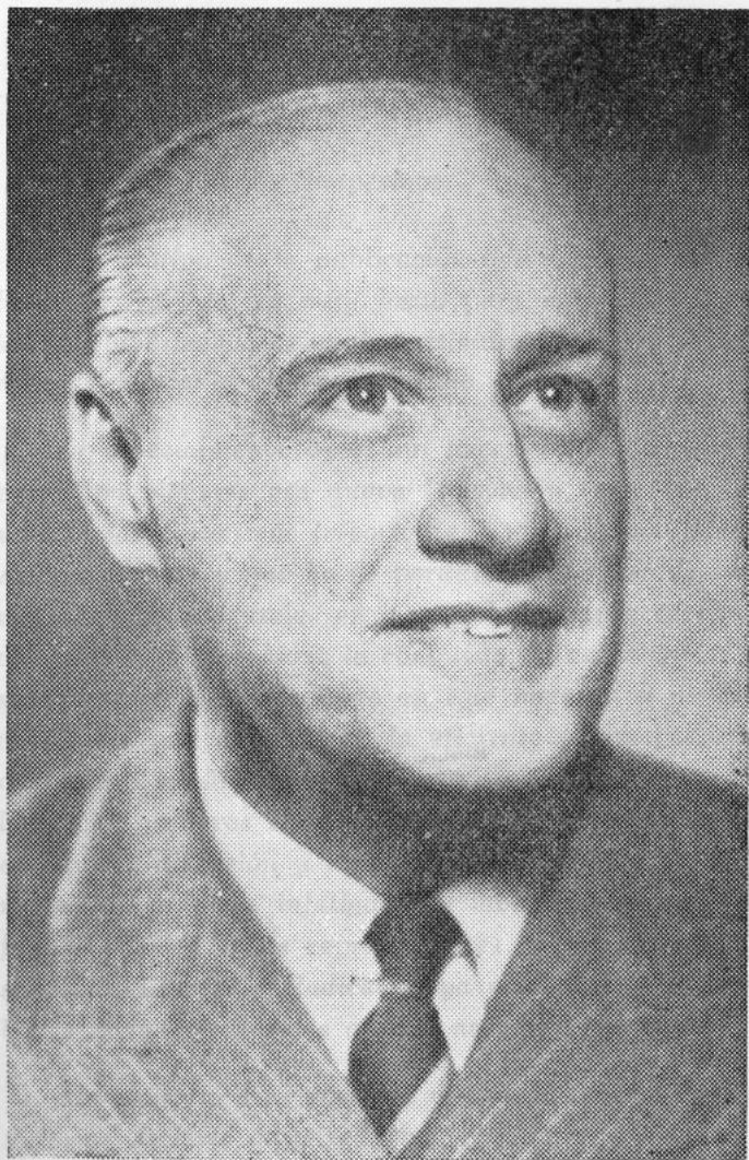
S. E. Don Jorge Alessandri Rodríguez