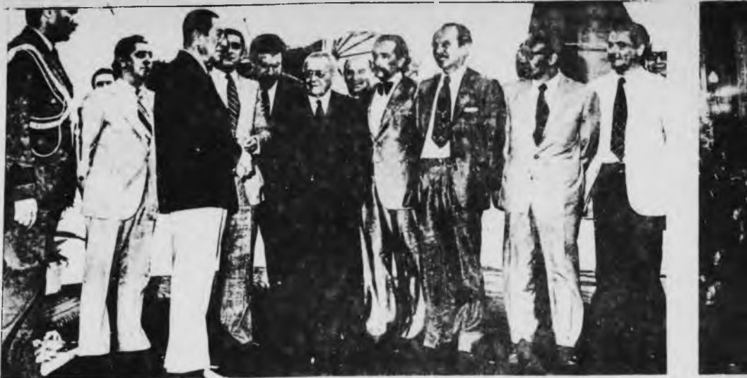
El bloque de los 8 sirvió para defender las "instituciones" y apoyar a Perón

■ El jueves pasado resucitó algo que todo el mundo daba por muerto (menos PD): el bloque de los 9. Esta vez con un ingrediente de importancia: la incorporación del partido Auténtico. La declaración de resurrección fue conocida textualmente por medio de La Opinión (19/6), y es la que reproducimos en esta página. Aunque la aclaración que sigue sea políticamente secundaria, precisemos que los firmantes son los comités de la Capital Federal, y no los nacionales, de los respectivos partidos.