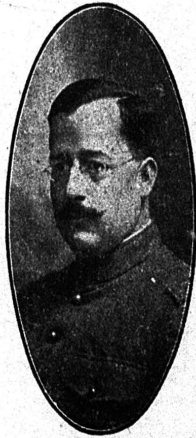
General Salvador Alvarado Gobernador del Estado de Yucatán

conveniente, les concedió la jornada de 8 horas y la semana inglesa de 44 horas, ha ayudado directamente a la fundación de cooperativas de producción y de consumo, ha promulgado leyes de trabajo y últimamente ha reducido a prisión a los miserables que so pretexto de la guerra europea y de la crisis nacional, han tratado de explotar al pueblo.