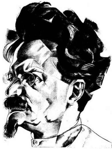
TROTSKY