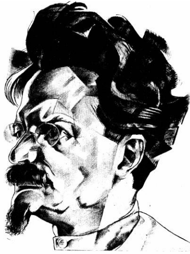
TROTSKY