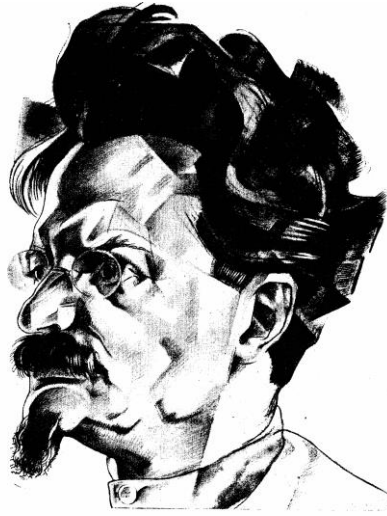
TROTSKY, per G. Amendot.