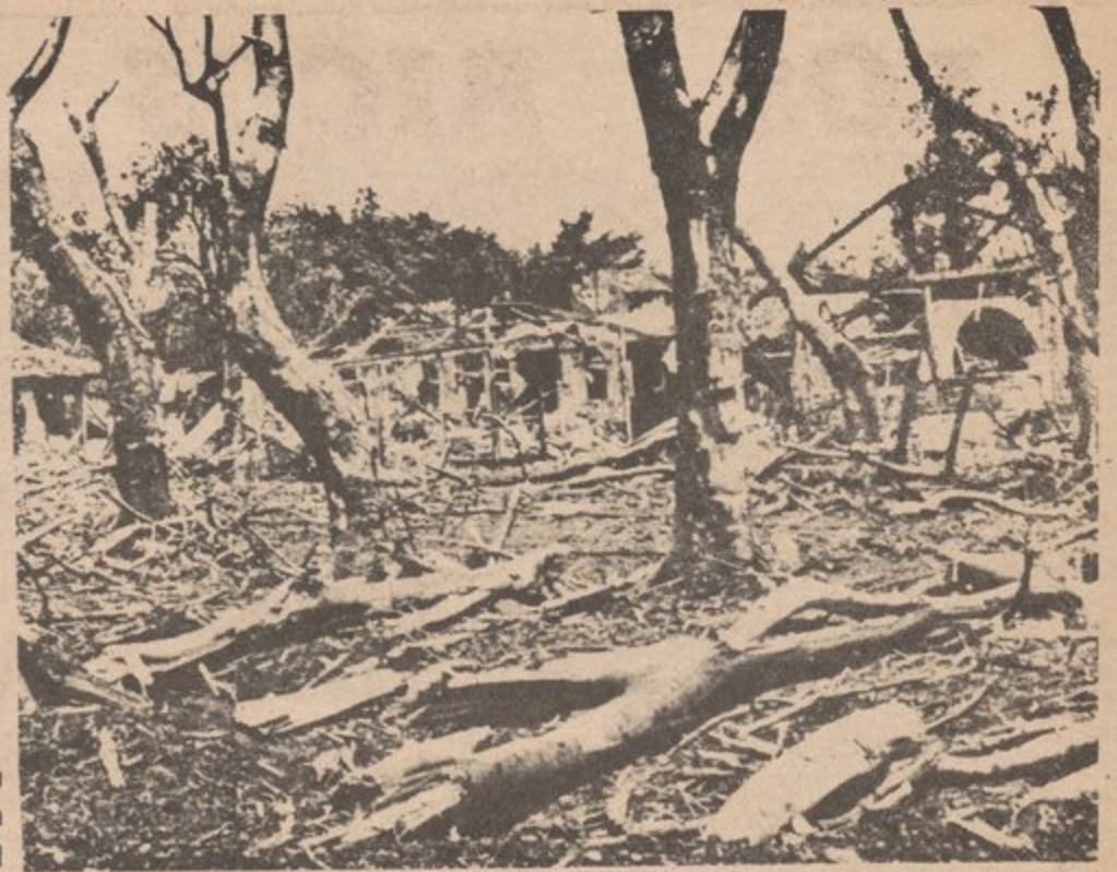
Efecto de las bombas de amerikkka en Vietnam.

Parte de la guerra estratégica de los e.u. es que los pueblos, las casas, los hospitales y los civiles también deben ser bombardeados