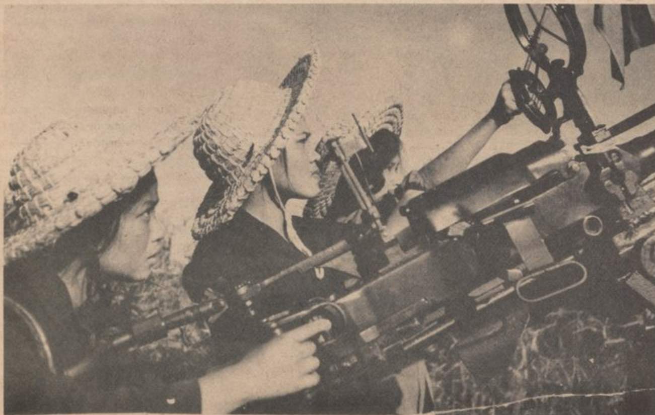
El pueblo se defiende de ataque norteamerikkkano.

Los amerikkkanos tienen miedo de la reacción de otros pueblos oprimidos ante sus ataques asesinos contra los vietnamitas. Para tratar de comprar la rabia de la gente, ellos han cancelado la conscripción militar por los próximos meses. Pero esto no servirá. Tenemos más en común con los vietnamitas que con los gobernantes ricos de amerikkka o de sus títeres vietnamitas y puertorriqueños. Nosotros nos mantenemos firmes junto a nuestros hermanos y hermanas de Indochina.