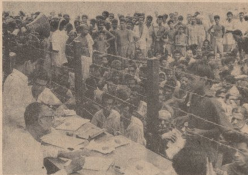
REFUGEES WAIT TO BE PROCESSED AT CALCUTTA CAMP

For instance, if there is a conflict in Santo Domingo, no other country has the right to invade (like the U.S. did in 1965). If the Indians really invaded for the freedom of the Bengalis, why did they use bombs against the same cities they were "freeing?" If the Indian government really wants freedom for the Bengalis, why doesn't it give freedom to the