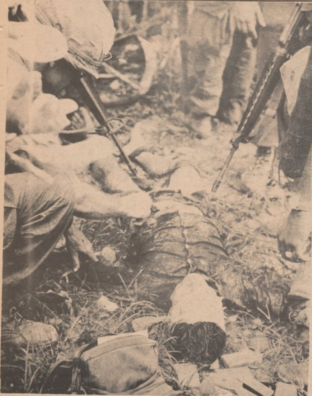
Brutalidad del pueblo Vietnamita de parte de los e.e. u.u.

En 1924 un joven periodista vietnamita llamado Nguyen Ai Quoc, escribió un artículo furioso y brillante condenando la costumbre norteamericana de linchar a Hermanos negros. Su artículo comenzaba así: "Como bien se sabe, el pueblo Negro es el más oprimido del mundo".