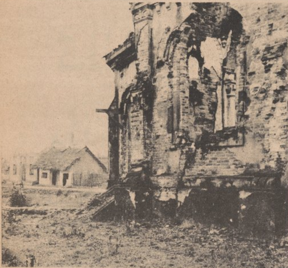
Church in N. Vietnam after amerikkan bombing