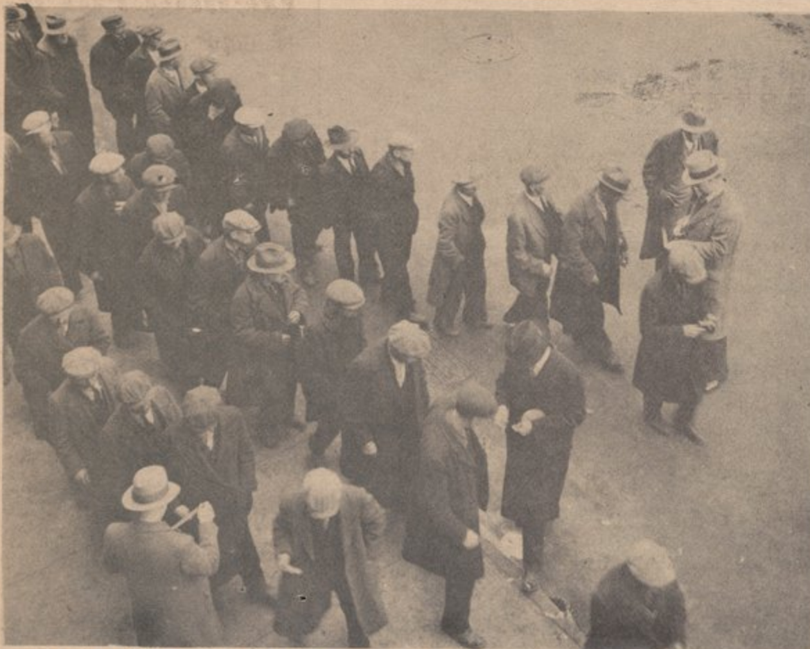
Capitalism undoubtedly causes depressions and suffering. (u.s.a., 1930)