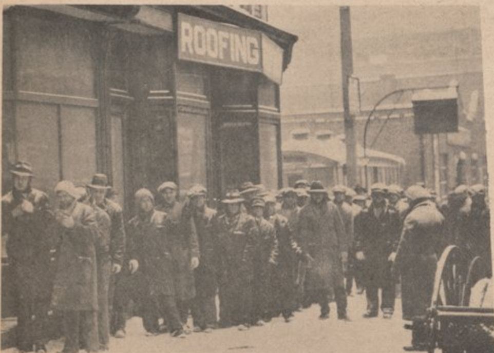
14 millones de trabajadores caminaban las calles desempleados.