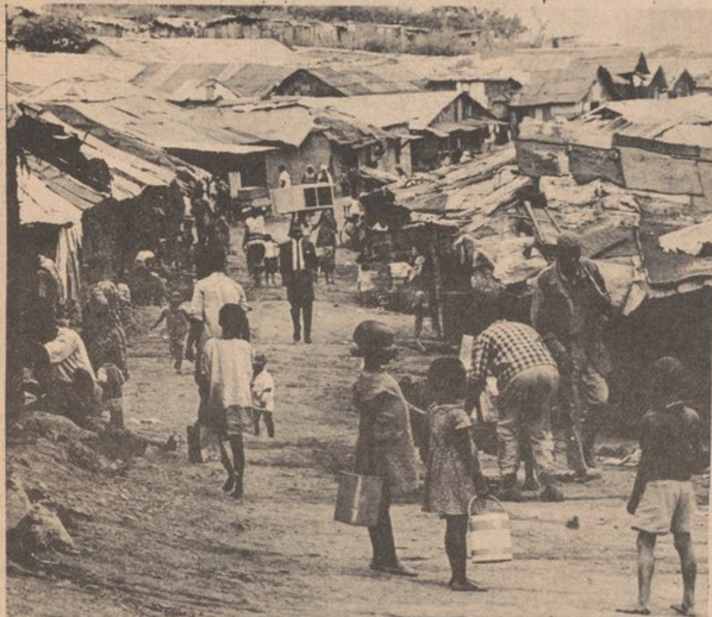
Aquí viven la gente pobre que son una mayoría,

forzados aquí por el gobierno de Sud Africa.