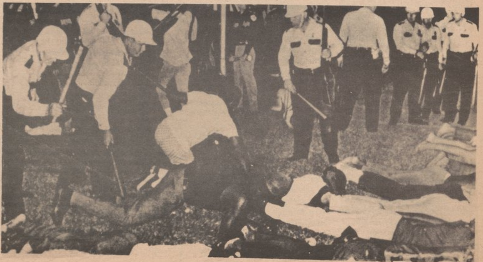
brutalidad contra el pueblo Afro-americano en los e.e.u.u.