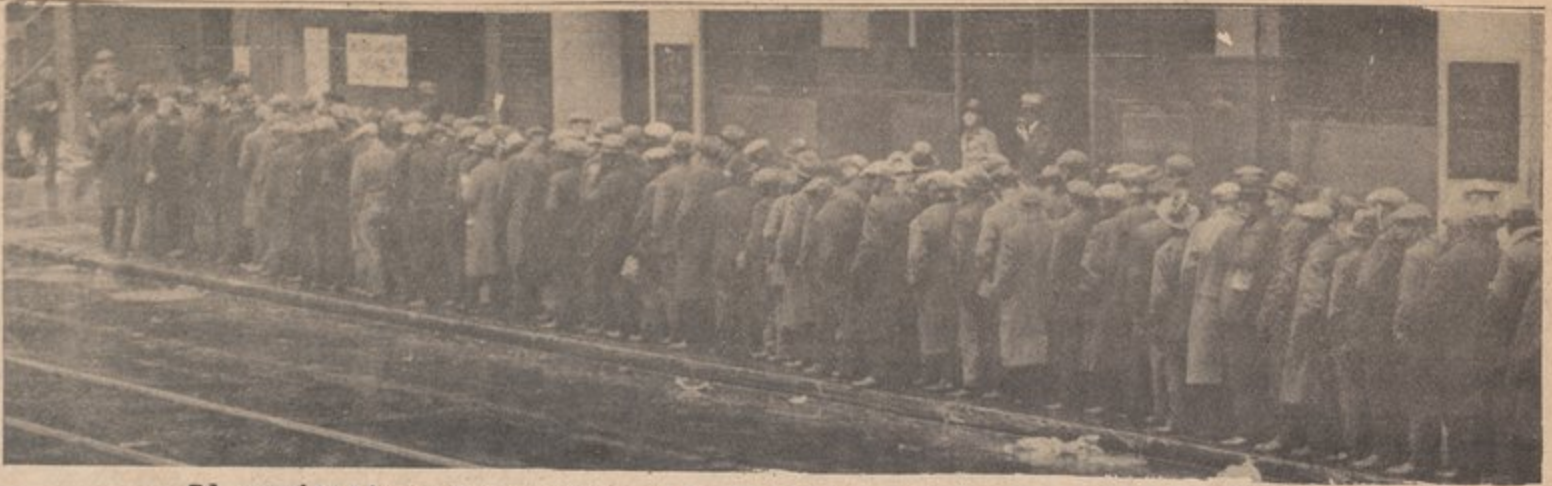
El capitalismo indudablemente causa depresiones y sufrimiento, e.u., 1930

Lo que sí le preocupaba era cómo iba a resolver sus problemas dentro de los eeuu, y cómo iba a bregar con competidores de otros países ricos que se aprovechaban de la situación.