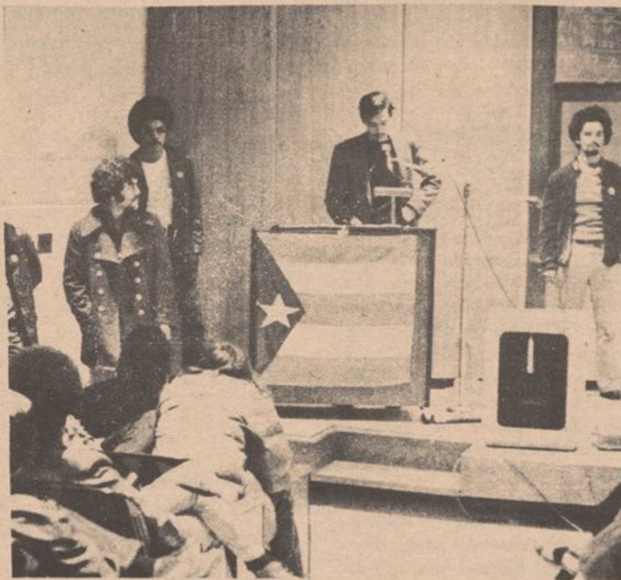
Esperamos que el futuro va a ver mas lucha unida entre los sirvientes del pueblo!.....

Esperamos que el futuro va a ver más lucha unida entre los sirvientes del pueblo.