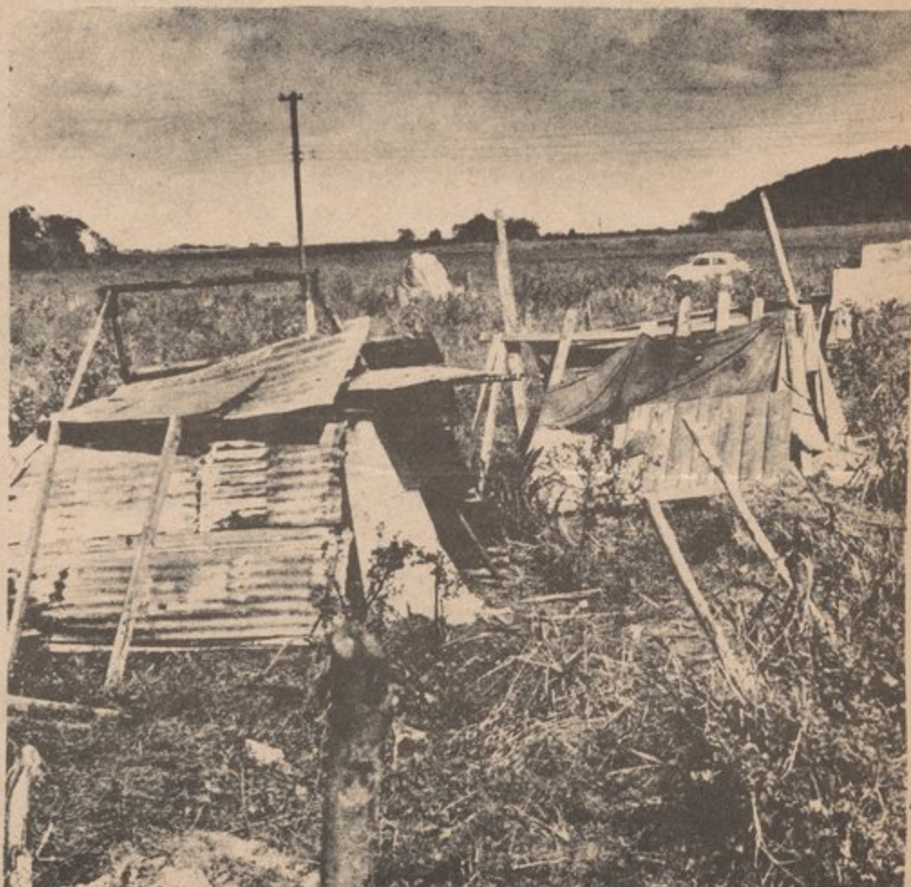
This isn't a den for animals ; human beings live here !