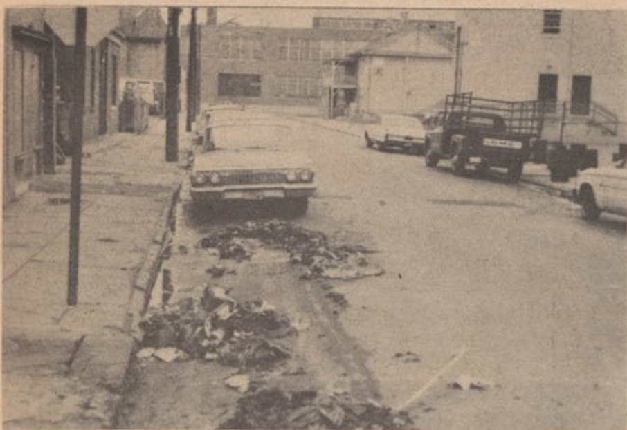
Ciudad Modelo ha fracasado en resolver nuestros problemas. (Bridgeport, Conn.)

Ya es tiempo que la gente de Bridgeport, especialmente la gente puertorriqueña y negra, empiecen a examinar con ojos y mentes abiertas el llamado programa de "Ciudad Modelo".