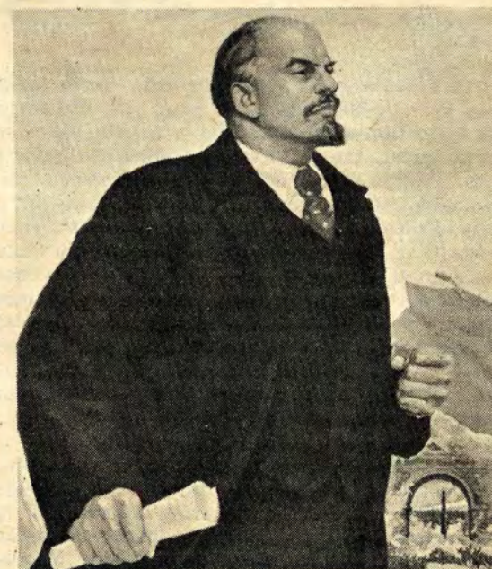
V. I. LENIN, GREAT LEADER OF THE OCTOBER REVOLUTION AND OF THE C. P. S. U. (BOLSHEVIK)

THIS MONTH WE ARE COMMEMORATING THE ANNIVERSARY OF LENIN'S BIRTH: