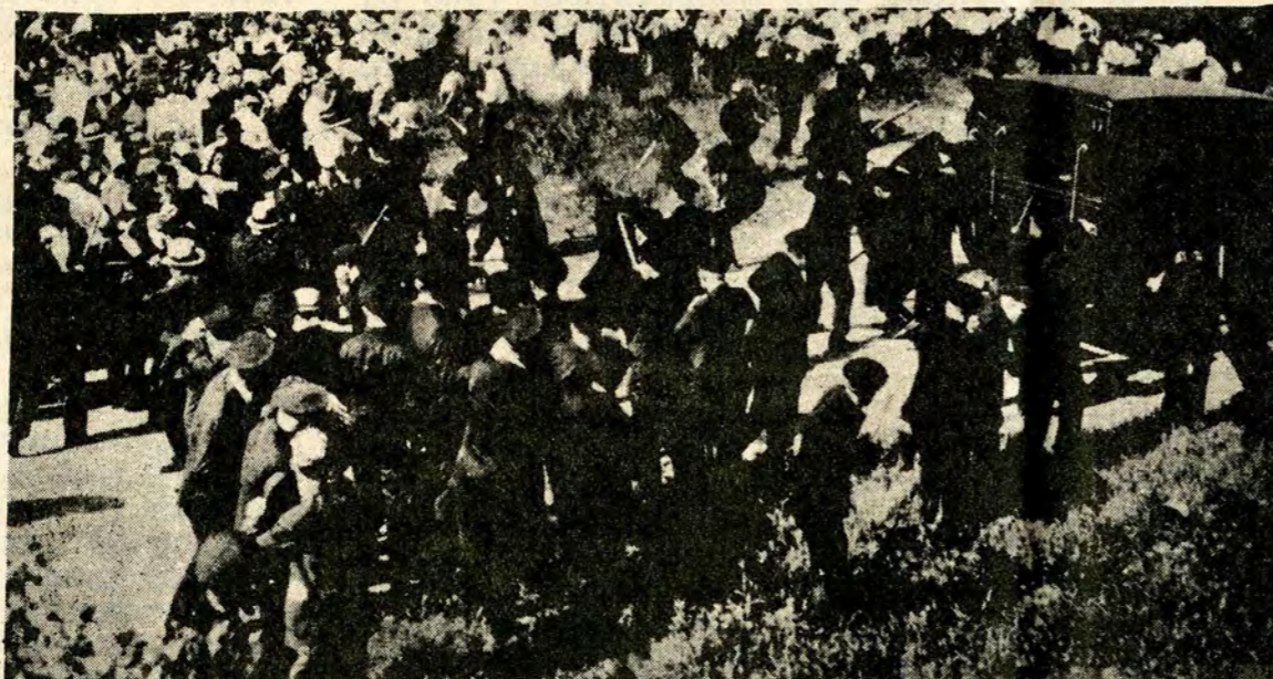
Memorial Day Massacre ... Chicago cops fire on Republic Steel workers, May 30, 1937 Toll: Seven strikers dead, 64 wounded. Twenty-six cops were injured