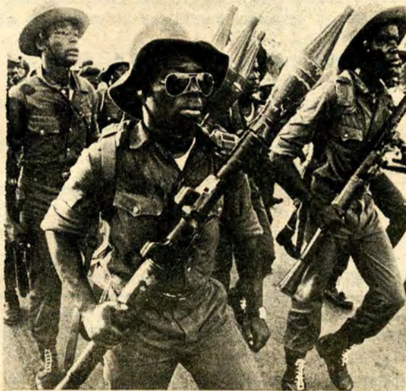
LUCHADORES HEROICOS DEL M.P.L.A.

Las fuerzas criminales del imperialismo estadounidense están interviniendo en Angola. Esta intervención amenaza con forzar a los obreros hacia una matanza imperialista. Parece que fue ayer cuando los imperialistas estadounidenses intervinieron en Indochina. Los obreros de este país llegaron a odiar a la guerra de Indo-China, la resistieron, y aun así el imperialismo es un sistema que tiene que explotar para existir.