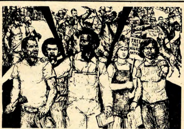
WORKERS PRESS proudly announces the publication of

Over the past six months the USNA has engineered a massive drive to crush the MPLA government and the Angolan peoples' struggle. A huge USNA arms lift to the FNLA and UNITA, coupled with timed assaults by South African regular troops and mercenaries briefly threatened the Angolan revolution.