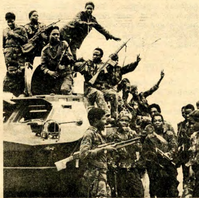
HEROIC M.P.L.A. FIGHTERS

WORKERS & OPPRESSED PEOPLE OF THE WORLD UNITE!