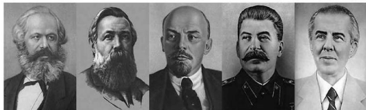
Karl Marx, Friedrich Engels, Vladimir Lenin, Joseph Stalin, Enver Hoxha