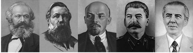
Karl Marx, Friedrich Engels, Vladimir Lenin, Joseph Stalin, Enver Hoxha 5 C l a s s i c s o f M a r x i s m

Comintern (Stalinist-Hoxhaists) http://ciml.250x.com