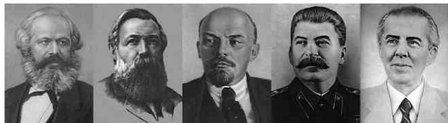
Karl Marx, Friedrich Engels, Vladimir Lenin, Joseph Stalin, Enver Hoxha