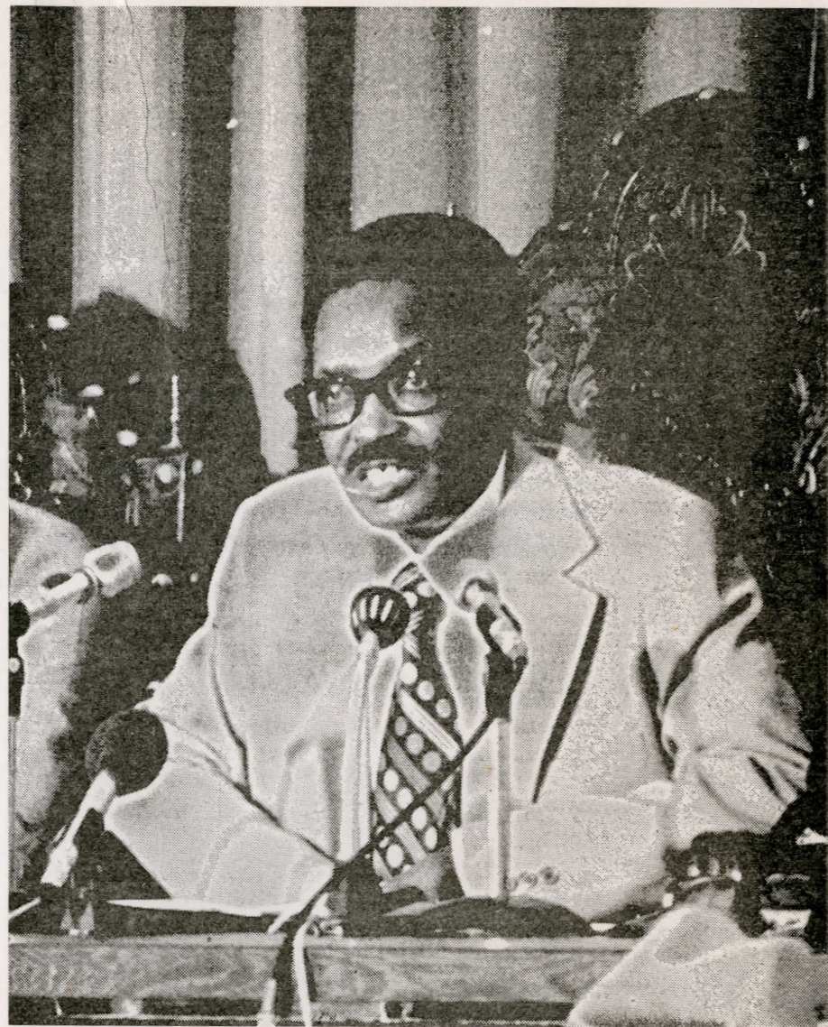
ANTÓNIO AGOSTINHO NETO Presidente do Movimento Popular de Libertação de Angola e da República Popular de Angola