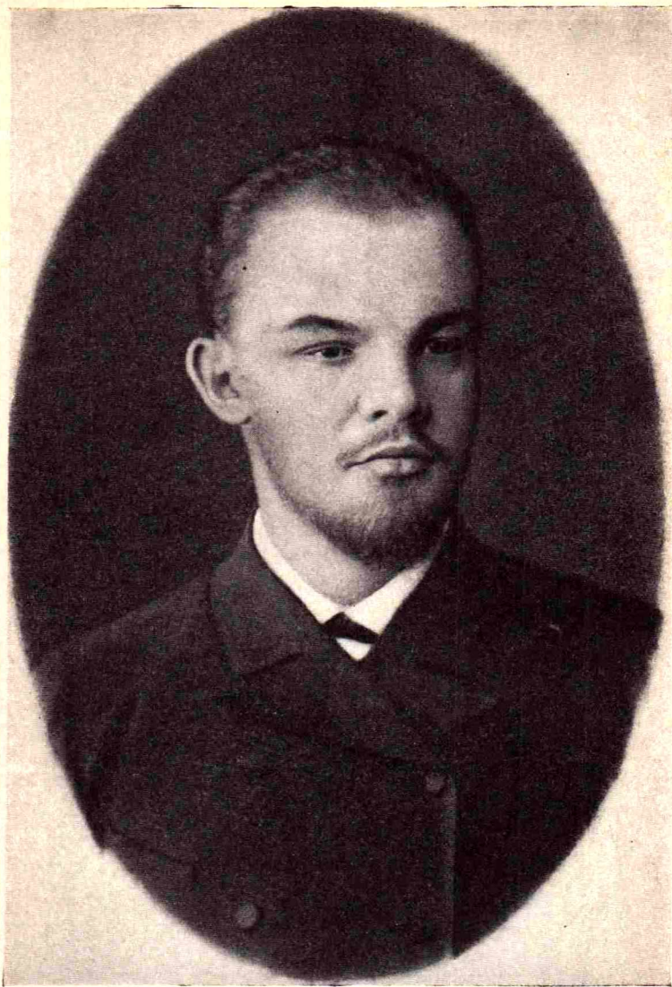
V. I. Lenin. Valokuva, 1890—1891.