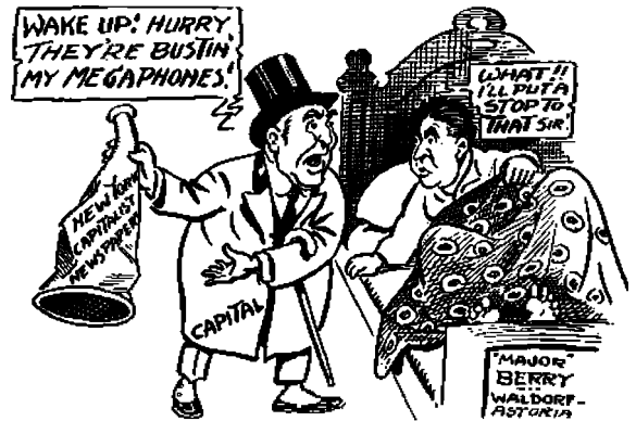
"Kello kolme aamulla"