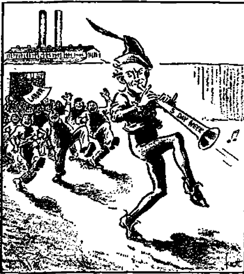
Pikkuparannuksilla on psykologillien vaikutus, sen tietää Ford, ja siksi hän niitä apuna käyttäen voi riistää työläisiään perin tehoisasti.

teen!” Näin huudahtavat jotkut porvarillisen käsityksen hedelmöittämät näyttelijät ja näytöksien filmauttajat. Omituinen satuma, että porvaristo näytelmissään pyrkii “elämän todellisuuteen” ja samalla aikaa jotkut työväen näytelmien kannattajat haluavat päästä pois “matalasta arkipäiväisyydestä.” Eräessä Suomen työläisten aikakausjulkaisussa — sosialidemokraattisen koulukunnan tuottama se kai oli — joku aika sitten lausuttiin, että “matalaa arkipäiväisyyttä on meidän näytelmissämme jo totisesti kylliksi nähty.” Tosiaankin me “voimme” kohota pois matalasta arkipäiväisyydestämme katsomalla yläluokkaan kuuluvien perhedraamoja, joissa “kankealla kie-