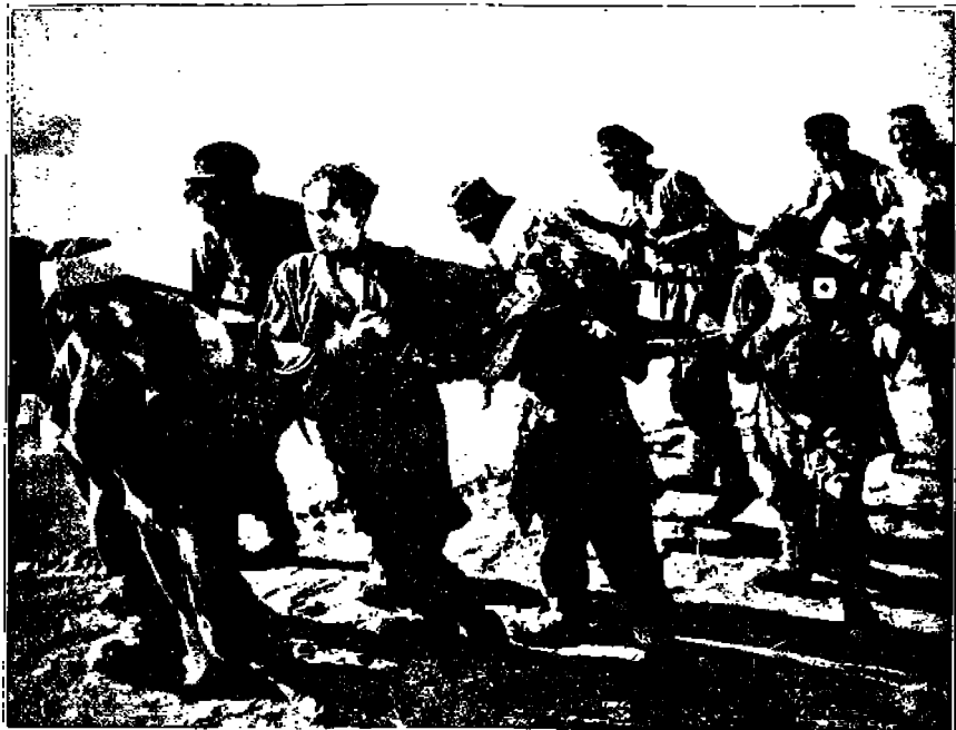
Kohtaus "Volga Boatman" filmistä