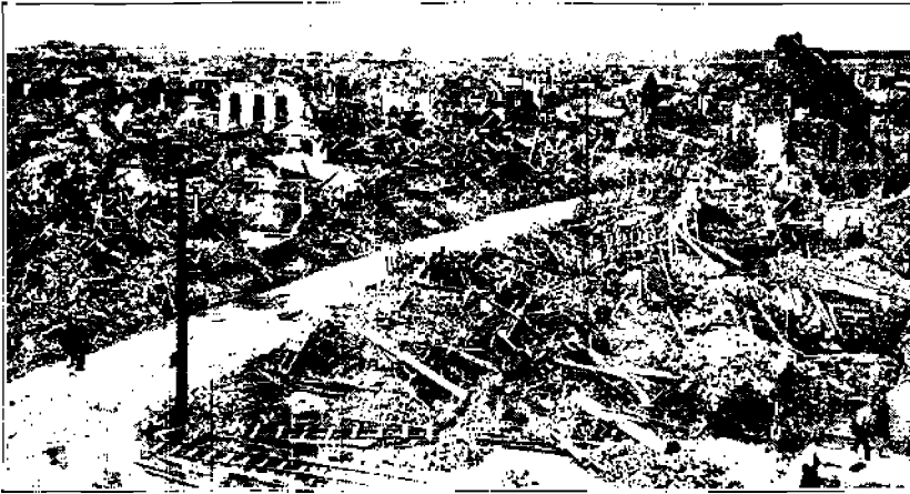
De Lens, jälkeen pommituksen, joka tapahtui sen jälkeen kun saksalaiset olivat valloittaneet kaupungin.

Vielä tosin ei ole voimakkaasti vaikuttamassa sellaiset voimat, jotka vaativat yleisesti pakolliseksi sotilasharjoituksia kouluissa. Mutta ne voimat, jotka haluavat saada vapaaehtoisen sotilasharjoituksen yleiseksi kaikissa kouluissa, toimivat ahkerasti. Lukemattomia eri keinoja käytetään kasvavan nuorison vetämiseksi näille kansalaisten harjoituskämpille, sotaleireille. Maitikaamme joukko niistä, jotta pääsisimme selville asian perusteista, ennenkaikkea sen vakaavuudesta.