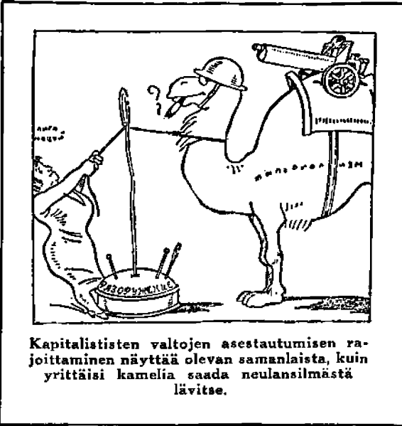
Kapitalististen valtojen asestautumisen rajoittaminen näyttää olevan samanlaista, kuin yrittäisi kamelia saada neulansilmästä lävitse.

viä ihmisiä löytyy. Kuinka moni tietää, että tässä maassa tällä kertaa sotilasharjoituksiin, seisovissa armeijoissa ja vapaaehtoisissa varajoukoissa, ottaa osaa noin kolme miljoonaa nuorukaista ja täysi ikäistä miestä sekä naista. Kirkoissa esille tuodut rukoukset taivaan herralle, vastataan sotavirastosta. Sellaista on Yhdysvaltain militaristinen politiikka tällä kertaa.