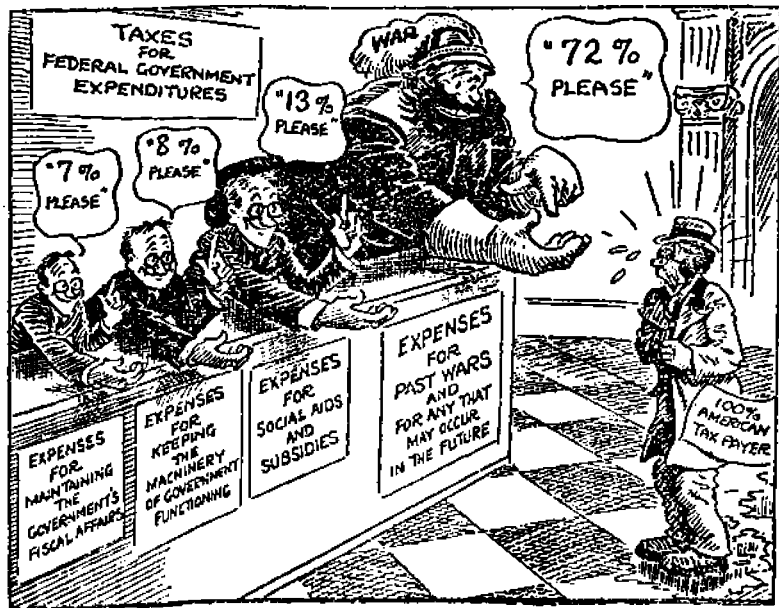
Miljoonat militarismille; sensuuria kasvatustyölle

Varsinaiseen n.k. kansalliseen puolustukseen käytettiin viimeksi päättyneellä fiskaalivuodella 730 miljoonaa dollaria, joka osoittaa, että tähän tarkoitukseen on viiden vuoden ajalla lisätty menoja 118,000,000 dollaria vuodessa. Ellei mitään muutosta tapahdu, tulee Yhdysvaltain kausan varoilla rakennettavaksi sotalaivastoa tulevan kuden vuoden aikana