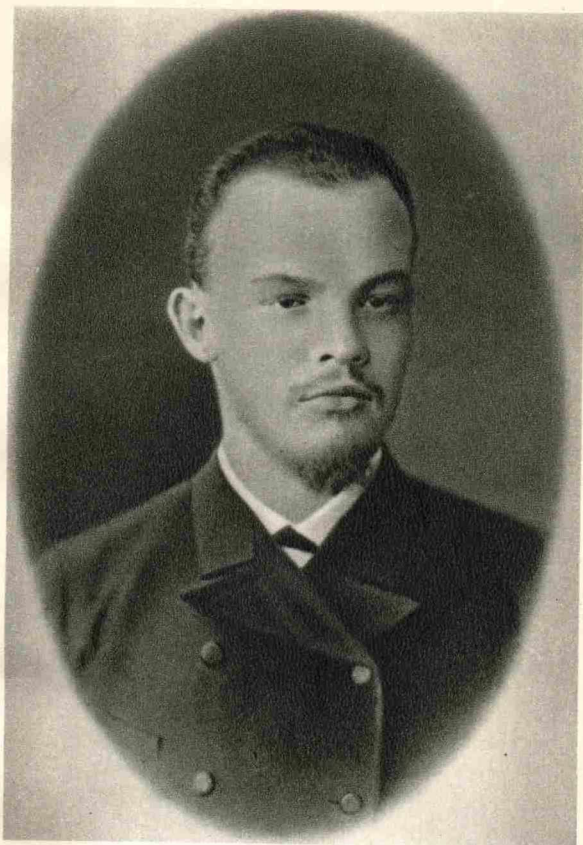
V. I. LENIN