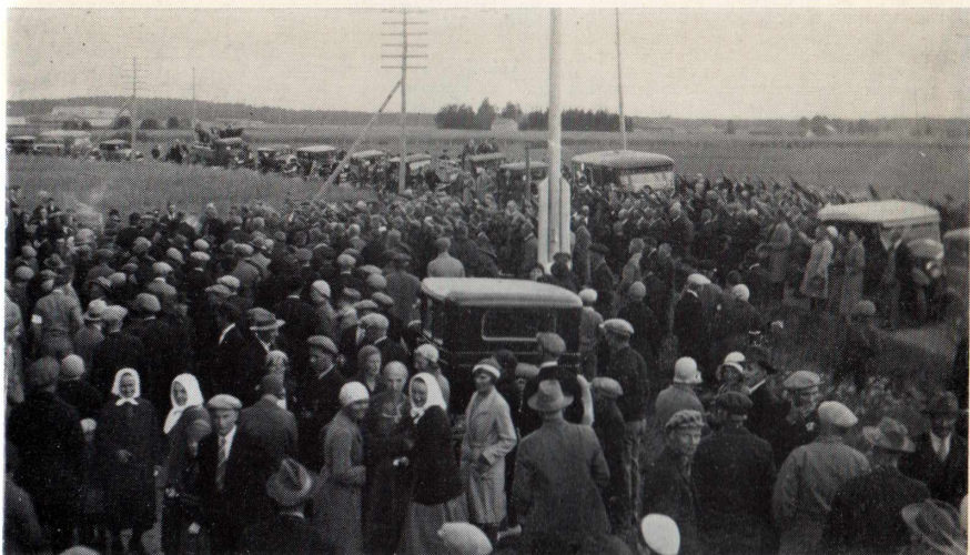
Mustapaitojen autokaravaani on tukkinut tien.

Vihtori Kosola oli ollut puhumassa Tampereella muutamaa päivää ennen sosiaalidemokraattisen puolueen puoluekokousta helatorstaina 1933. Hän oli vaatinut puheessaan sosiaalidemokraattisen puolueen lakkauttamista. Siitä sain aiheen lausua hänestä muutamia ponnekkaita sanoja ja kuvasta päättäen näyttää, että olen tukenut esitystäni myös käsin.