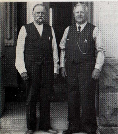
Presidentti Kyösti Kallion kanssa olimme vanhat hyvät ystävät. Meillä oli luottamuksellisia keskusteluja kaikista hallituksessa esille tulleista asioista. Kävin myös kesäisin tapaamassa häntä Kultarannassa, josta kuva.