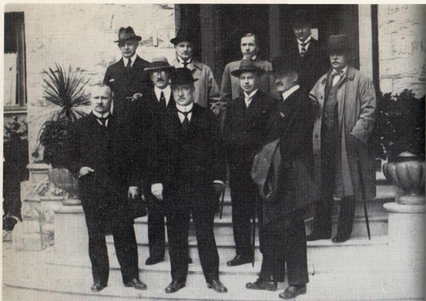
Genovan konferenssi oli kutsuttu koolle Englannin pääministeri Lloyd Georgen aloitteesta. Se epäonnistui täydellisesti. Tässä olen päässyt kuvaan eräiden konferenssin osanottajien kanssa.