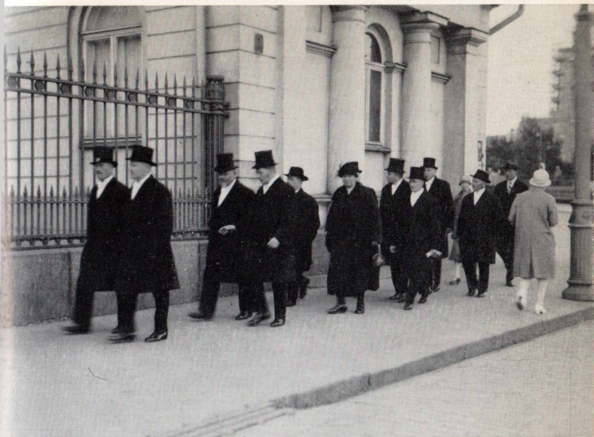
Tannerin hallitus menossa esittäytymään presidentti Relanderille 13.12.1926. Joukossa näkyy myös Suomen ensimmäinen naisministeri Miina Sillanpää.