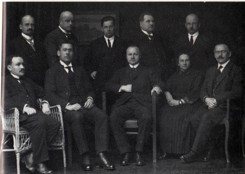
Sosiaalidemokraattisen puolueen puoluetoimikunta 1919—1922 kuvattavaksi järjestäytyneenä.