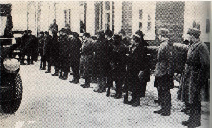
Viimeinen ojennus Mäntsälän suojeluskuntatalolla. Oven yläpuolella oli teksti: Tervetuloa.