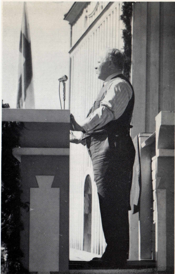
Kävin mielelläni puhumassa sosiaalidemokraattien kesäjuhlilla. Sortavalassa puhuin kesäkuussa 1939. Ilma oli lämmin ja olen heittänyt takin pois.