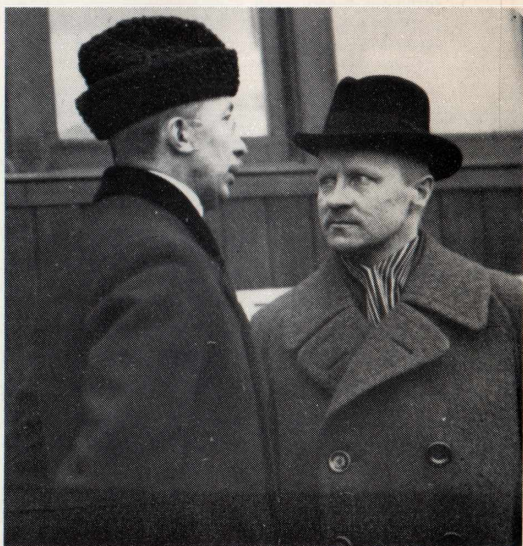
Lähtiessäni Genovan konferenssiin keväällä 1922 motin vielä asemalla Holstia hänen hiljattain Varsovassa tekemästään reunavaltiosopimuksesta ja ennustin, ettei eduskunta hyväksyisi sitä.