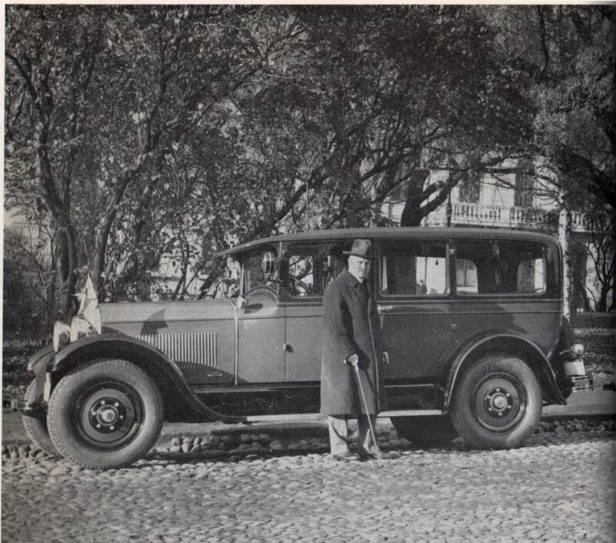
Hallitukseni aikana hankittiin valtioneuvostolle uusi auto, jonka edessä 'poseeraan' lokakuussa 1927.