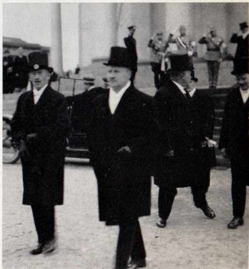
Pääministerinä ollessani minun oli pakko opetella kirkonmenojenkin kaava. Kirkosta palaamassa 1927.