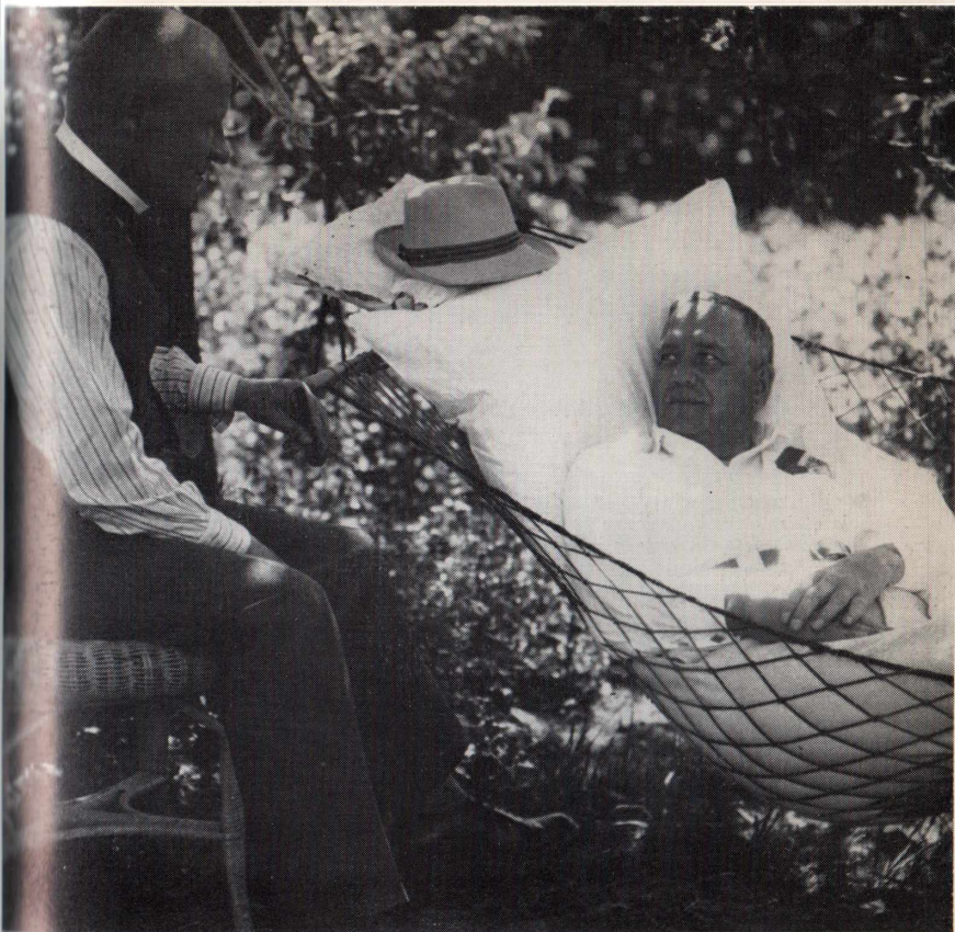
Presidentti Relanderin sairastuttua keväällä 1927 jouduin toimimaan koko kesän v.t. presidenttinä. Kävin muutaman kerran tapaamassa presidenttiä Kultarannassa, jossa hän oli sairaslomalla. Keskusteluja käytiin leppoisasti ulkosalla.