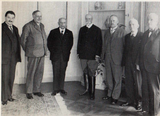
KOL:n exekutiivi eli toimeenpaneva valiokunta Tšekkoslovakian presidentin vieraana Lanyn linnassa. Masaryk (kuvassa keskellä) oli maansa presidenttinä vuosina 1918—1935 ja oli tunnettu myös filosofina ja sosiologina.